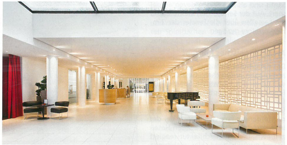
Schon beim Betreten des Gebäudes fällt einem die Orientierung leicht. Am Ende der Lobby steht ein grosser Glaskubus, der mit Weinflaschen bestückt ist.

Da nachhaltiges Bauen ein Kernthema der Migros Ostschweiz ist, wurden Heizung und Kühlung über mehrere Erdsonden realisiert und das neue Gebäude und die Haustechnik gemäss dem Minergie-Standard umgesetzt. Bei der Auswahl sämtlicher Baumaterialien wurde ausserdem darauf geachtet, materialökologisch sinnvolle Produkte zu wählen, so zum Beispiel halogenfreie Kunststoffe bei den Elektroinstallationen, FSC-zertifiziertes und schadstoffarm verarbeitetes Konstruktionsholz sowie emissionsarme Farben. Die reversible Wärmepumpenanlage sorgt für Wärme wie Kühlung. 80 % der für die Wärme-