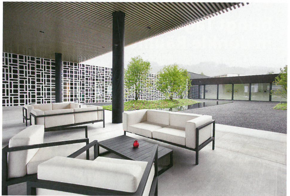
Die Innenarchitektur und die Möblierung ist zurückhaltend, klar, wohltuend entspannt, aber keineswegs langweilig.

Neben den Neubauten wurde der gesamte Eingangsbereich mit Lobby und Réception neu organisiert.