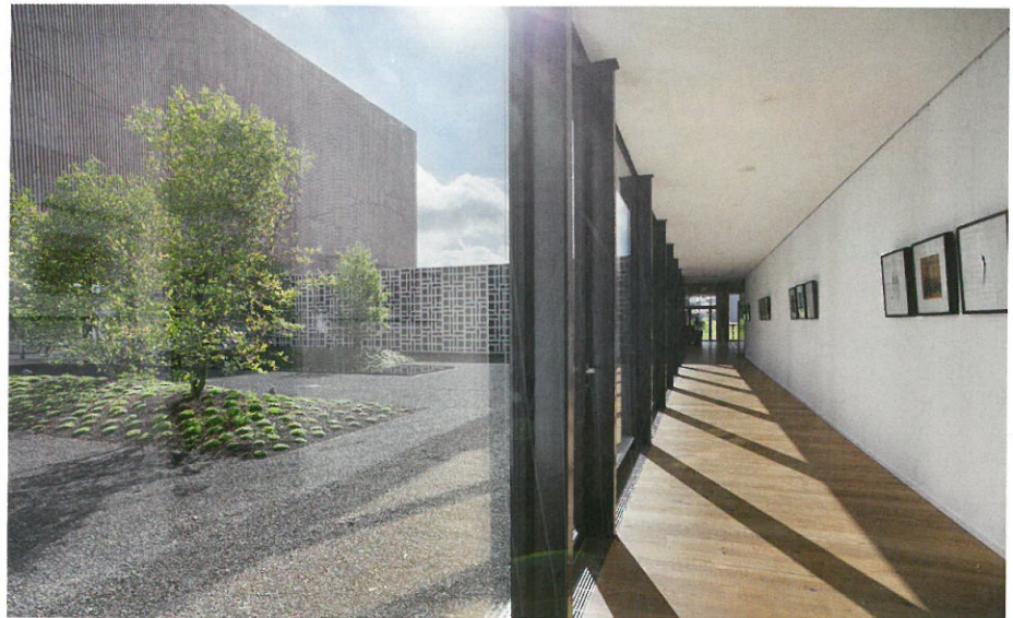
Einfache Körper schliessen zwei Höfe ein und schaffen einen grosszügigen Park im Süden.