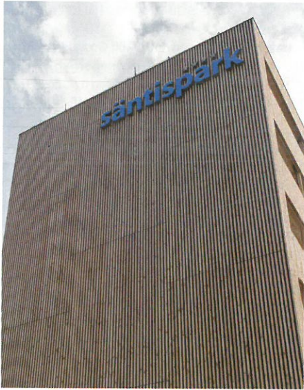
Für die Fassade wurde Douglasie verwendet.