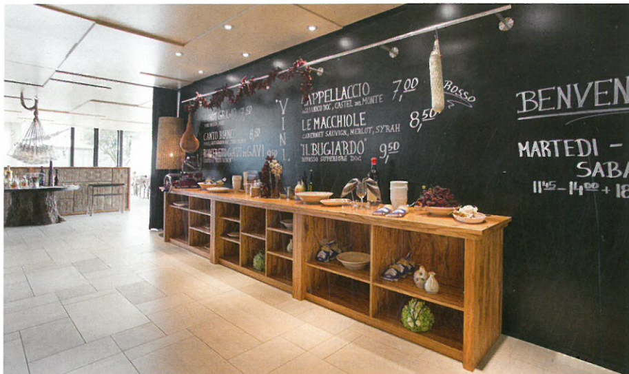
Im Ristorante Uliveto werden kreative Gerichte aus den verschiedenen Regionen Italiens serviert.