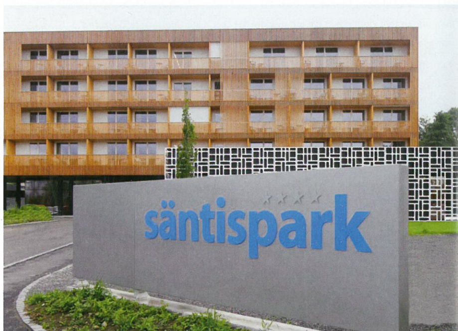
Das Zentrum für Medizin & Sport ist mit einem weissen Schleier umgeben.

ten des Zentrums für Medizin und Sport (ZMS) und des neuen Hotelteils erstellt. Das ZMS und die Pit Stop Lounge & Bar konnten am 19. Mai 2014 eröffnet wer-den. Die Gesamteröffnung des Hotels fand am 15. August 2014 statt. Der kom-plette neue Hotelteil und der Park waren Ende September 2014 fertiggestellt. Der Architekt Carlos Martinez aus Bern-eck hat mit seinem Architekturbüro den Erweiterungsbau des Hotel Säntis-park entworfen. Sein Konzept hat sich in einem internationalen Wettbewerb gegen die Entwürfe namhafter Architek-ten durchgesetzt. Der Erweiterungsbau wurde durch den Generalunternehmer HRS Real Estate AG realisiert. Insgesamt hat die Genossenschaft Migros Ost-schweiz rund 40,4 Millionen Franken in die Erweiterung investiert.