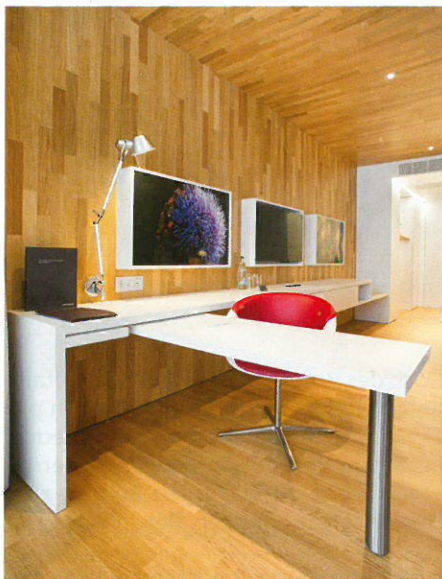
In den Gästezimmern erscheinen sämtliche Wände, Böden und Decken im gleichen Eichenholz.

Das neue Hotel Säntispark will vier Nutzergruppen ansprechen: Geschäftskunden, Gesundheitsbewusste, Sportler und Freizeitgäste. Die optimale Architektur für diese vier sehr unterschiedlichen Gruppen zu finden, war eine grosse Herausforderung, vor allem auch bei der Innenarchitektur, speziell bei den Hotelzimmern. Die Innenarchitektur reagiert darauf zurückhaltend, klar, wohltuend entspannt, aber nicht langweilig. In den Gästezimmern erscheinen sämtliche Wände, Böden und Decken im gleichen Eichenholz. Nur das Bett und die Sitzmöbel stehen auf dem Boden. Alle Einbauten im neuen Holzbau sind in mattem Weiss gestaltet und so lackiert, dass sie haptisch weich anmuten.